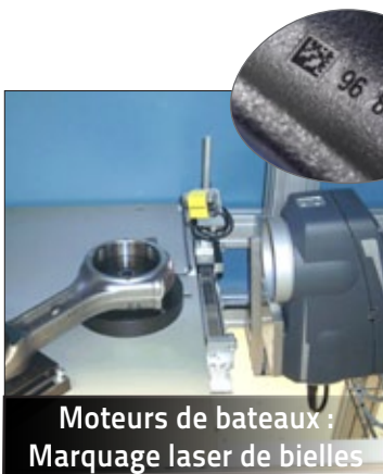
Moteurs de bateaux : Marquage laser de bielles