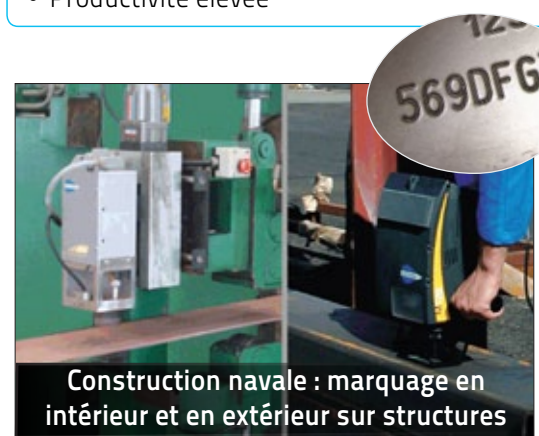
Construction navale : marquage en intérieur et en extérieur sur structures

Savoir-faire... Technifor est le premier fabricant mondial de machines de marquage permanent pour la traçabilité et l'identification automatique de pièces métalliques et plastiques.